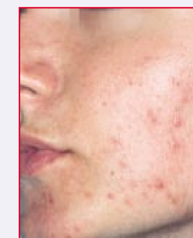
Durante il peeling