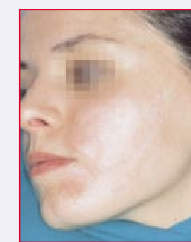
Durante il peeling